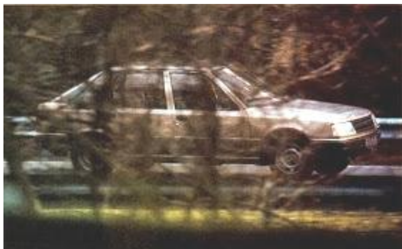
Een van de eerste prototypes van Talbot Arizona destijds gespot door de Spaanse auto pers.